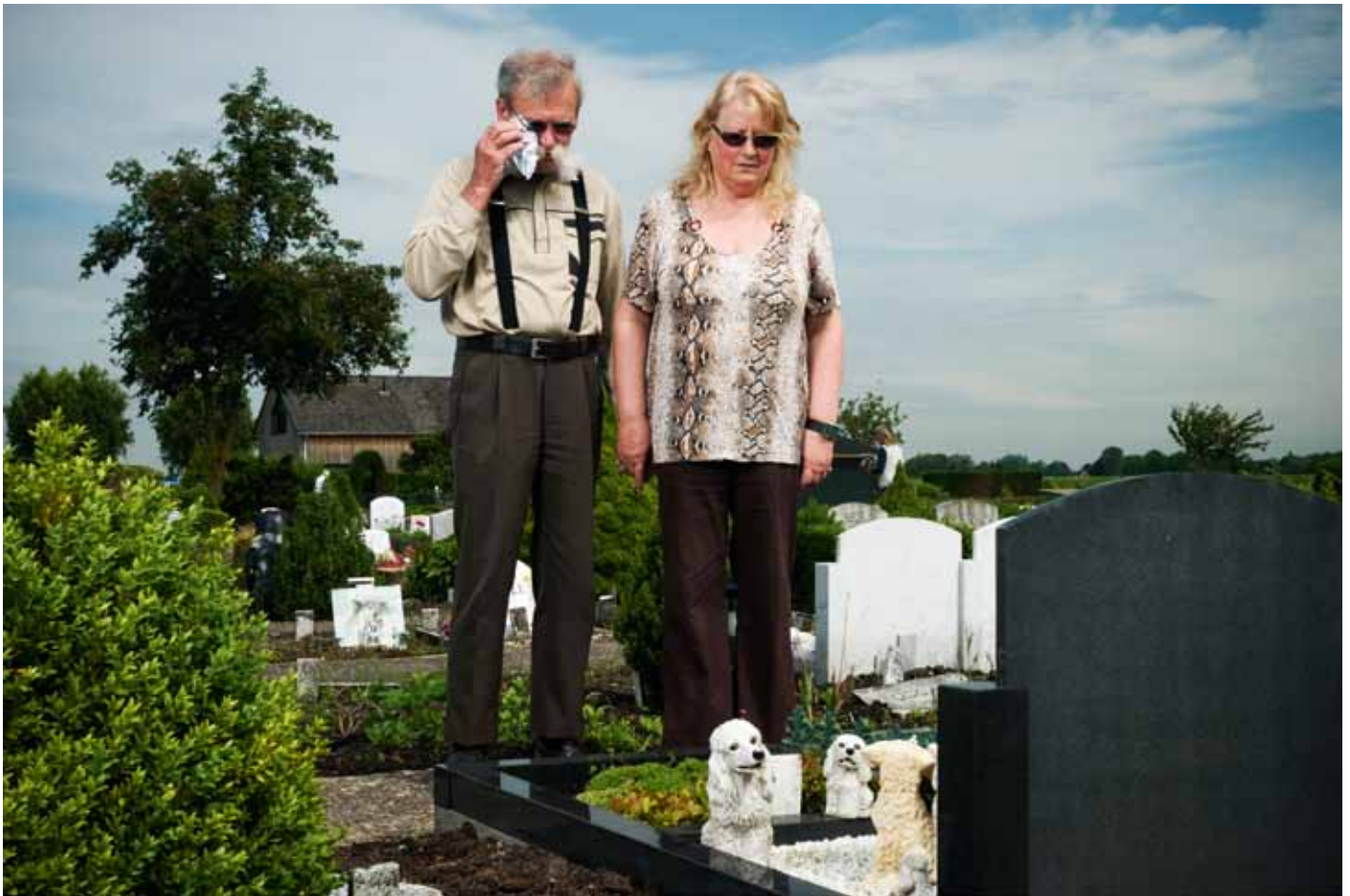
Dierenkerkhof Van Dees.

heel anders leeft dan over het algemeen wordt aangenomen.